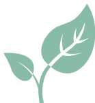
SFALCI E POTATURE