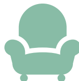
INGOMBRANTI E GRANDI PLASTICHE