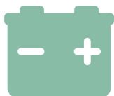
PILE ESAUSTE E BATTERIE AUTO