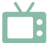
RAEE (Tutti i materiali elettrici ed elettronici)