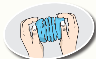
压扁塑料瓶并拧紧瓶盖以减小体积

塑料无需洗涤, 但如果包装/容器非常脏, 则只需简单冲洗即可, 并且确保无食物残留, 否则会产生异味。